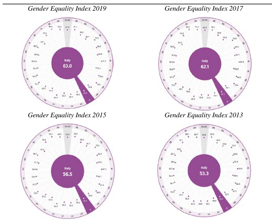
Fig. 1 - Indice dell'uguaglianza di genere